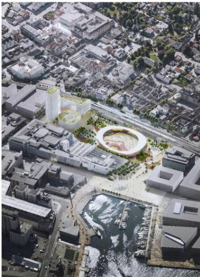
Sirkelen "Lysning" blir en viktig og karakteristisk del av byparken på Ruten. Selv festplassen for konserter og lignende, blir lagt mot havneområdet. Busser på bussveien er den eneste motoriserte ferdselen som blir tillatt foran Tinghuset i nord (til høyre) og inn i Elvegata. Alle andre busser får gjennomgang i Julie Eges gata i sør, sør for tre nye næringsbygg som settes opp der dagens oppstillingsplass for busser er.

- Vi planlegger nytt parkeringshus over bakken i Havneparken nord for Tinghuset, Amfi har fortsatt sitt eget parkeringshus i øst. Under Bystasjonen i sør er det allerede 370 parkeringsplasser og mye ledig.