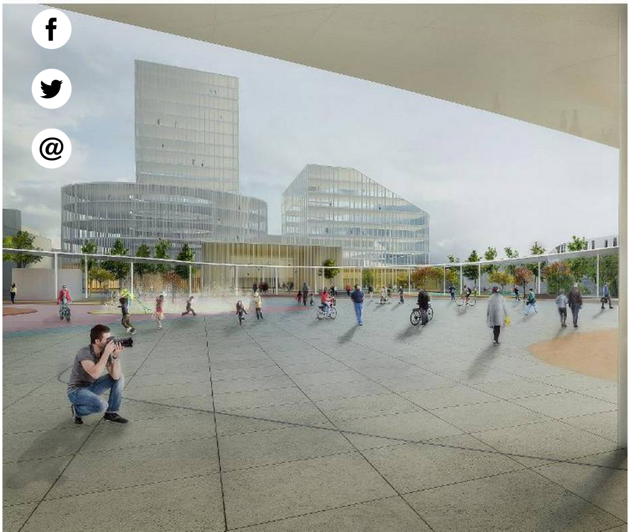
Under sirkelen "Lysning" sett fra nord mot sør, skal det bli masse liv og gjerne handel, til og med torghandel. I sør ses de nye næringsbyggene. FOTO: Ill: Sandnes Tomteselskap